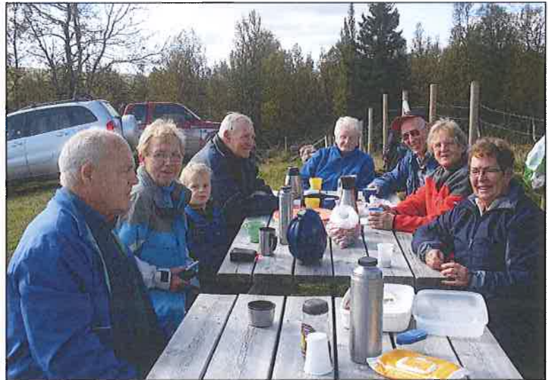
Eit godt dugardsmåltid høyr dugnadsarbeid og sausanking til.

Fjellstyre. Vekta med utstyr kostar åleine om lag 70000 kroner. Eit skur med god plass til vekta og dei som skal gje ordre om kor sauen skal, er god å ha i desse regnvers-tider. Underlaget som sauen går på, er bærelag og grov grus som drenerer godt så ein slepp å vasse i gjørme. Det set også sauen pris på der den kjem springande ut frå den einskilde eigar si avdeling i karusellen. Sauene blir sankt i dagane før veginga, men har ei kve på 70 dekar å gå på, så det vil ikkje ha store utslaget på vektene.