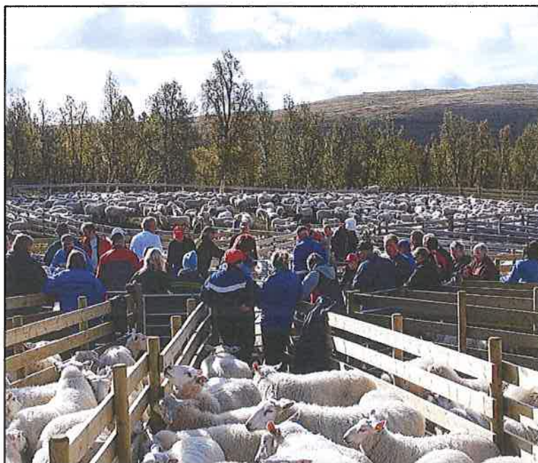
Tett i tett og på rekke og rad står sauane i ein nybygd karusell. Klar til å forlate beitet på Fåvangfjellet.

Slaktemodne lam kan køyrast rett til slakteriet. "Beite og arbeid spart og pengar tent". Slaktebilane står klare, for å sikre seg dei fyrste delikatessene rett frå fjellet. Men dei har også tanke for dei som skal leva vidare, og køyrer søyer og